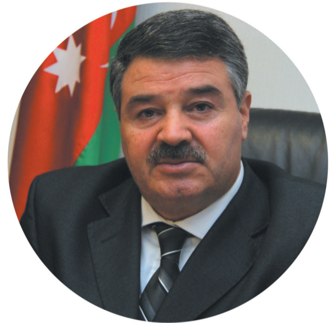
“Битва за Ходжали виростила національних героїв”

Яким для Вас в пам'яті залишився день 26 лютого 1992 року? Як досягти справедливості для Ходжали? Чим важлива пам'ять про Ходжалинську трагедію для Азербайджану і в цілому для світу?